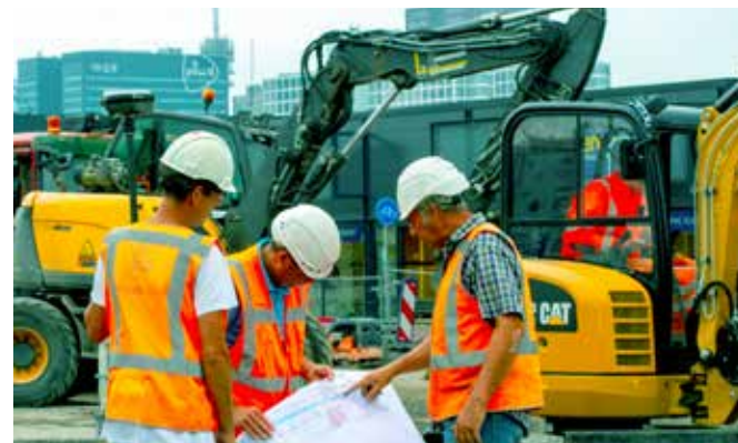
NLCS voorkomt interpretatiefouten tijdens de uitvoering (Project Binckhorstlaan Den Haag)