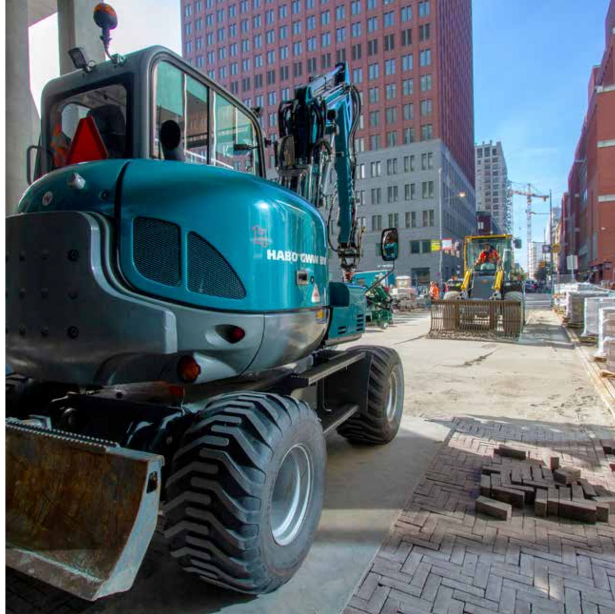
Machinaal aanbrengen van bestrating aan de Haagse Loper in Den Haag.

Bijkomend voordeel van werken met een uniforme standaard is de overdraagbaarheid. Remmerswaal: “Onze tekenaars werken vooral aan hun eigen projecten, maar het komt wel degelijk voor dat ze werk overdragen. Stel dat de ene collega een tekening opstelt en een andere de revisie uitvoert. Die kan zo verder werken, zonder zich extreem in de tekening te hoeven verdiepen. Overigens zie ik altijd een directe link tussen de NLCS en InfraCAD, de AutoCAD plugin. Sterker nog: zonder InfraCAD is er voor mij geen NLCS. InfraCAD heeft veel voordelen en werkt heel intuïtief. Natuurlijk, in het begin kost het tijd om het te leren. Ook wij hadden het idee dat er in korte tijd veel op ons af kwam. Maar als je je er even in verdiept, leer je al snel heel veel.”